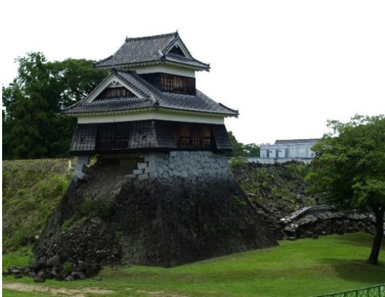
↑石垣の崩れた跡が残る熊本城戌亥櫓