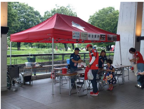
↑私がお世話になった総合案内 写真①