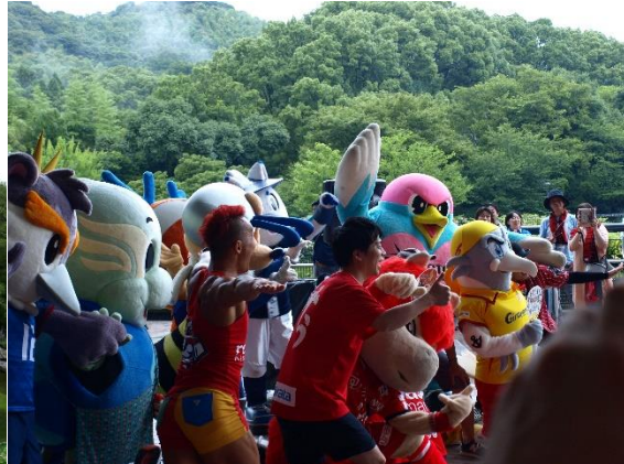
↑九州だJ クラブマスコット集結