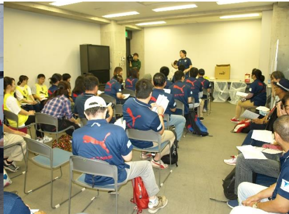
↑試合前のミーティング